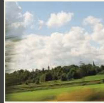
Nästa generations resor och transporter