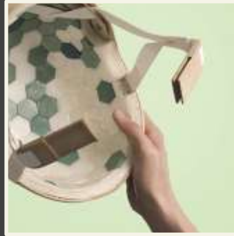
Cirkulär och biobaserad ekonomi